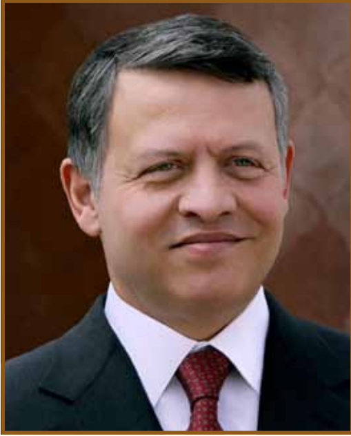
جلالة الملك عبدالله الثاني ابن الحسين

تحت رعاية صاحب الجلالة الملك عبدالله الثاني ابن الحسين، يعقد في مقر ملتقى طلال أبوغزاله المعرفي يوم الحادي عشر من شباط ٢٠١٣ في عمان الملتقى الاستشاري الإقليمي العربي لمنظمة التجارة العالمية.