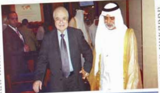
مبارك بن مبارك يفتتح الملتقى الدولي للربط التقني للتحية الإلكترونية في إطار البنى العا