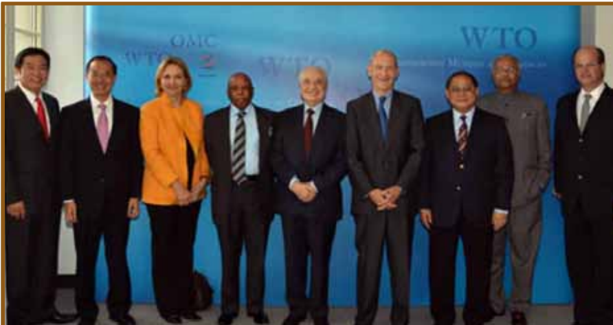
فريق خبراء منظمة التجارة العالمية

ويهدف هذا الملتقى إلى تبادل وجهات النظر بين منظمة التجارة العالمية ممثلة بمديرها العام السيد باسكال لامي وعضو فريق الخبراء الدكتور طلال أبوغزاله من جهة ومع صانعي القرار وأصحاب العلاقة في المنطقة العربية من جهة أخرى. وإبراز وجهات النظر والمواقف والمصالح العربية تمهيدا لتقديمها إلى المؤتمر الوزاري المقبل للمنظمة.