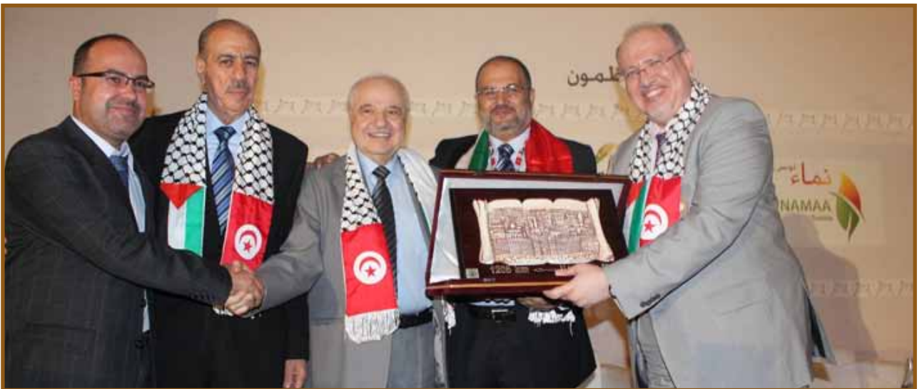
درع المنتدى للدكتور طلال أبوغزاله

وأوضح أن فريق عمل من الشباب وبإشراف دائرة تطوير المواقع الإلكترونية في مجموعة طلال أبوغزاله يعكفون حالياً على استكمال معلومات ومحتوى الموسوعة العربية «تاجيبديا» التي تحتوي على المعلومات الصحيحة التي تعكس واقعنا وتاريخنا وحضارتنا مشيراً على سبيل المثال إلى أن المعلومات عن مدينة القدس في الوكيبيديا هي عاصمة «إسرائيل»، بينما جرى تصحيح هذه المعلومة في تاجيبديا بأنها عاصمة الدولة الفلسطينية.