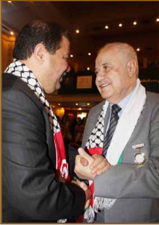
... ومع وزير الإستثمار التونسي