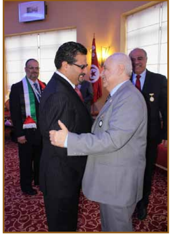
د. أبوغزاله يصافح وزير الخارجية التونسي

وتطرق د. أبوغزاله إلى الأوضاع في المنطقة العربية وقال: «أن ما تشهده بعض الدول العربية إنما هي نهضة عربية وليس كما يشاع ربيعاً عربياً لأن ما يحصل هو نهوض بالأمة مشيراً إلى أن هذه النهضة قد تكلفنا الكثير من التضحيات وقد تستمر لعدة سنوات حتى تقطف ثمارها كما حصل في النهضة الأوروبية التي إستمرت نحو عشرين عاماً».