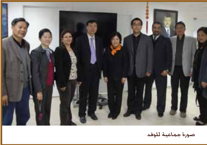
صورة جماعية للوفد

عمان - زار وفد صيني رفيع المستوى يمثل اتحاد قوانغدونغ للعلوم الانسانية والاجتماعية معهد طلال أبو غزاله كونفوشيوس (تاج - كونفوشيوس) لمناقشة أفق التعاون المستقبلي بين الطرفين.