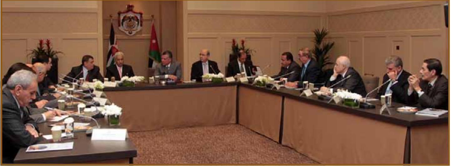
جلالة الملك يستقبل اللجنة الملكية

• تطوير الأطر التي تنظم العلاقة التشاركية بين القطاعين العام والخاص. وأكد جلالة الملك على ضرورة تحلي اللجنة بأقصى درجات الحيادية والموضوعية في تأدية مهامها الوطنية. مشدداً جلالته على أهمية قيام اللجنة بالتشاور والتواصل والحوار مع جميع مؤسسات المجتمع المدني. بما فيها الأحزاب والنقابات. والقوى السياسية المختلفة. والانفتاح على الرؤى والأفكار التي يطرحها المواطنون وأصحاب الخبرة. بحيث تستند اللجنة في عملها الى هذه الأفكار في اعداد ما يلي: