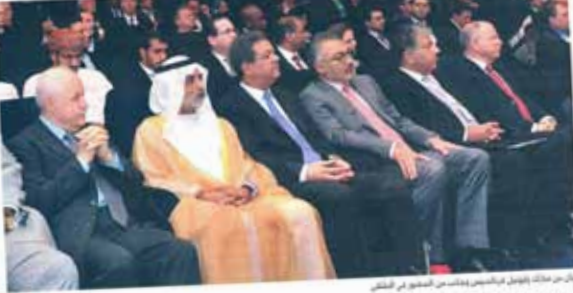
نهيان بن مبارك يفتتح الملتقى الدولي للربط التقني للبنى التحتية الإلكترونية في جامعة زايد