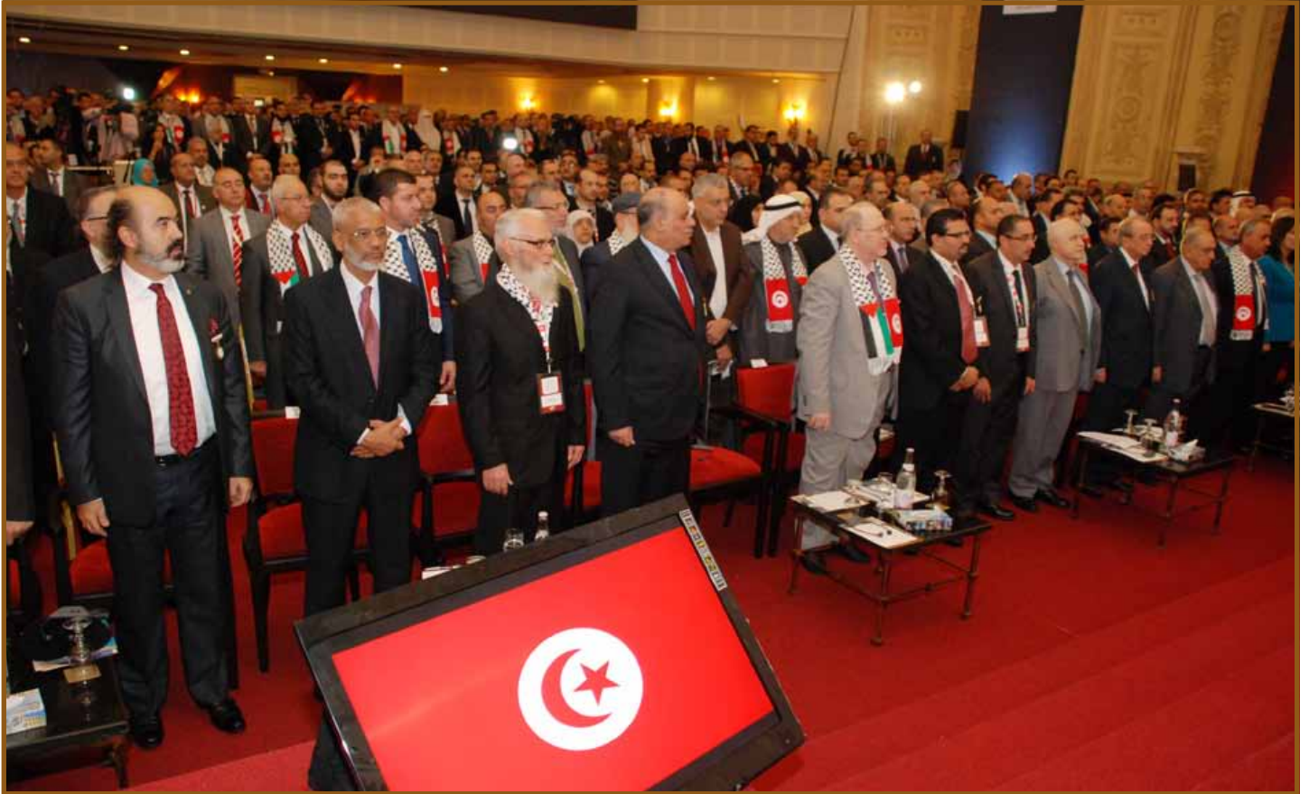
وزراء ومسؤولون ورجال أعمال

تونس، أعلن الدكتور طلال أبوغزاله رئيس جمعية «كلنا لفلسطين» أمام المؤتمر الثالث لمنتدى الأعمال الفلسطيني الذي عقد في تونس أنه سيعمل جاهداً على إدراج فلسطين في منظمة التجارة العالمية وفي عضوية المنظمة العالمية للملكية الفكرية وأية هيئات دولية أخرى متخصصة بعد إقرار الجمعية العامة للأمم المتحدة بدولة فلسطين عضواً مراقباً.