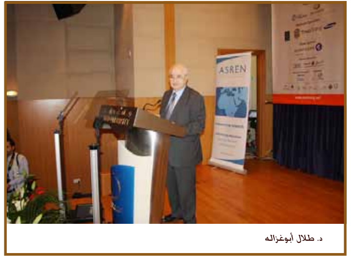
د. طلال أبوغزاله

بالإضافة إلى الأوساط الأكاديمية والباحثين وممثلين عن جامعة الدول العربية، واليونسكو، والمفوضية الأوروبية وغيرها من المنظمات العالمية.