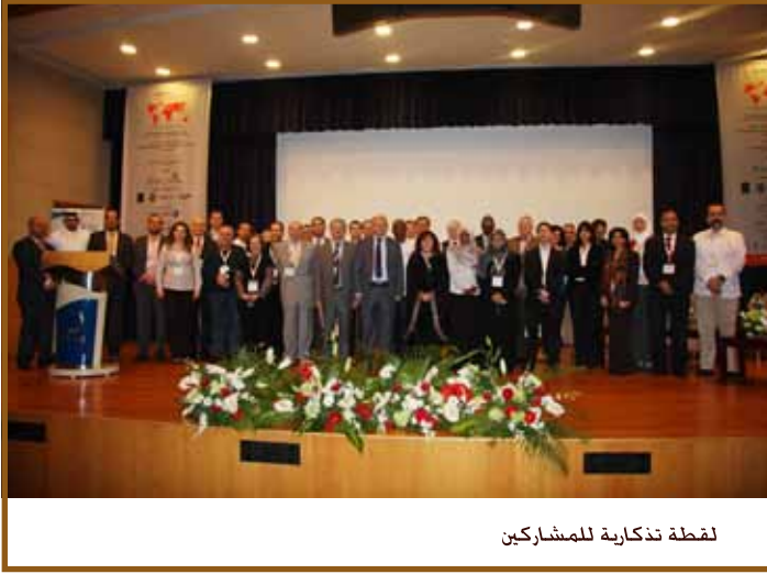
لقطة تذكارية للمشاركين