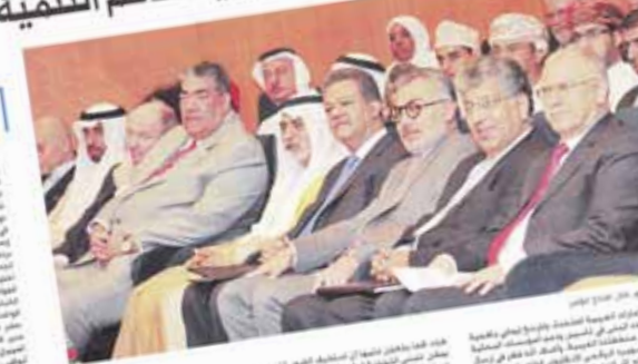
نهيان بن مبارك يفتتح الملتقى الدولي للربط التقني للبنى التحتية الإلكترونية في جامعة زايد