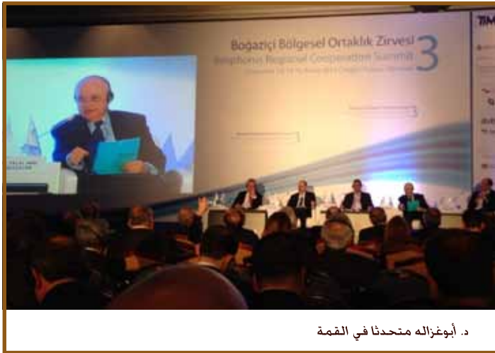
د. أبوغزاله متحدثاً في القمة

وبهذا الصدد أكد أبوغزاله أن القوة الإقتصادية هي مصدر ومحرك السلطة السياسية العسكرية، وعلينا التسليم بحقيقة أن المستقبل هو خلق الثروة من المعرفة وبأن النمو في التجارة العالمية مستقبلاً يكمن في التجارة الإلكترونية.