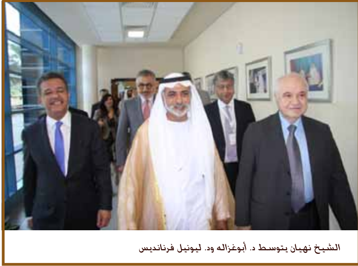
الشيخ نهيان بن تومست د. أبوغزاله ود. ليونيل فرنانديس

المنظمة حتى الآن لكي تكتمل المنظومة. واطلاق الربط الاولي لشبكة البحث والتعليم والتكامل بين العلماء العرب والمضي نحو الابداع والريادة والانتاج العلمي المبدع