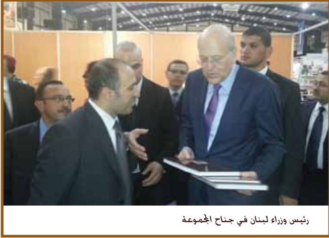
رئيس وزراء لبنان في جناح المجموعة

بيروت - شاركت مجموعة طلال أبوغزاله في معرض بيروت الدولي للكتاب العربي السادس والخمسون لعام ٢٠١٢ الذي أقيم برعاية وحضور رئيس الوزراء اللبناني الأستاذ نجيب ميقاتي في مركز بيروت الدولي للمعارض والترفيه. وجرى تنظيمه من قبل اتحاد الناشرين اللبنانيين بمشاركة العديد من دور النشر من كافة أنحاء العالم.