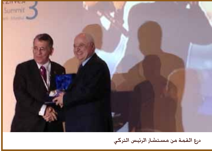
درع القمة من مستشار الرئيس التركي

اسطنبول - تحت رعاية فخامة الرئيس عبدالله غول رئيس الجمهورية التركية، عقد في قصر سيراجانا أعمال قمة البوسفور الثالثة للتعاون الإقليمي بحضور مسؤولين حكوميين ورجال أعمال من 49 بلداً من مختلف أنحاء الشرق الأوسط وشمال أفريقيا ومنطقة الخليج وتركيا ودول البلقان.