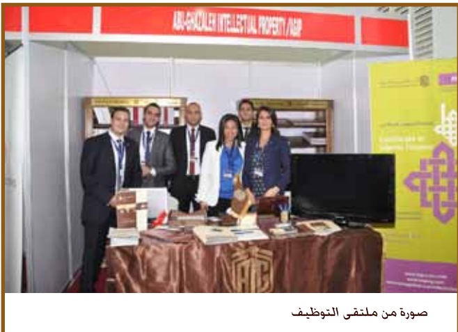
صورة من ملتقى التوظيف

القاهرة - شاركت أبوغزاله للملكية الفكرية في ملتقى التوظيف النصف سنوي الذي نظمته الجامعة الأمريكية. ويوفر الملتقى تنمية وتطوير العلاقات المنهارة بين خريجي الجامعة الأمريكية بالقاهرة وعالم الشركات حيث أن الملتقى يدمج بين احتياجات أصحاب العمل ومهارات ومؤهلات خريجي الجامعة الأمريكية .