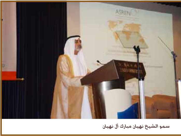
سمو الشيخ نهيان مبارك آل نهيان