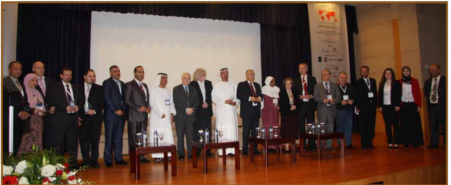
دع المنظمة تكريما للمشاركين

وتقدم أبوغزاله بعدد من التوصيات للبحث والدراسة وتركزت على. الدعوة لانضمام شبكات البحث والتعليم في الدول العربية الوطنية غير